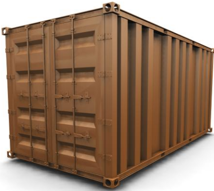
Container zum Transport von Ware

In einer chinesischen Turnschuhfabrik werden die Turnschuhe hergestellt und anschließend kontrolliert und in Kartons verpackt. Nun beginnt ihre lange Reise! Die Kartons werden in einem Container verstaut und anschließend mit einem Lkw zum Hafen transportiert. In einen herkömmlichen Container passen ca. 6 000 Schuhkartons. Meistens werden in einem Container aber verschiedene Waren wie zum Beispiel Turnschuhe, T-Shirts und Hosen transportiert.